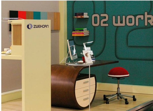
Der frei schwebende „APB-Schreibtisch“ als einer von drei ausgestellten Elementen der Zweihorn® Kampagne „Die Zukunft lebt von Ideen“, Fotos: Akzo Nobel Wood Coatings GmbH – Geschäftsbereich Zweihorn