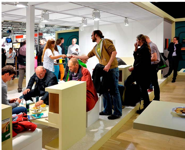
In regelmäßigen Vorträgen und vielen Fachgesprächen erläuterte Zweihorn® moderne Farbkonzepte.