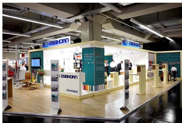
Zweihorn® Messestand und Produktpräsentation auf der Holz-Handwerk 2014.