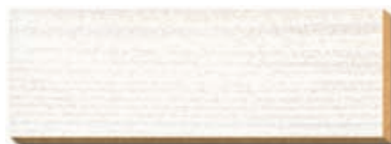
PB 11 Weiß Fichte/Tanne / épicéa / spruce / abete / spar