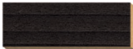
PB 08 Espresso (stark strukturgebürstet) Fichte/Tanne / épicéa / spruce / abete / spar