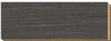
PB 13 Betongrau Eiche / chène / oak / rovere / eik

Hinweis: Farbtonabweichungen sind drucktechnisch bedingt. Es empfiehlt sich grundsätzlich eine Probebeizung/-lackierung an verdeckter Stelle. Gebeizte Proben sind vor Beurteilung zu lackieren.