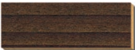
PB 10 Kaffee (stark strukturgebürstet) Fichte/Tanne / épicéa / spruce / abete / spar