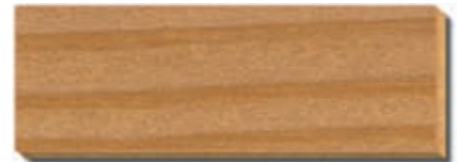
PB 06 Crema Fichte/Tanne / épicéa / spruce / abete / spar