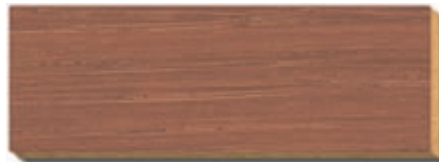
PB 05 Kakao Eiche / chène / oak / rovere / eik