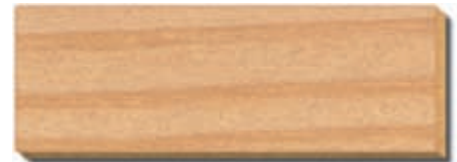
PB 04 Melange Fichte/Tanne / épicéa / spruce / abete / spar