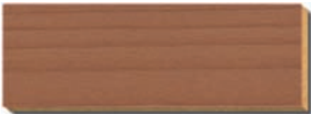
PB 05 Kakao Fichte/Tanne / épicéa / spruce / abete / spar