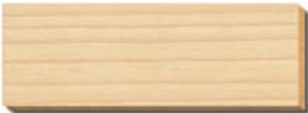
PB 02 Vanilla Fichte/Tanne / épicéa / spruce / abete / spar