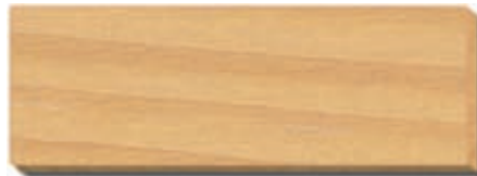
PB 03 Champagne Fichte/Tanne / épicéa / spruce / abete / spar