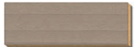
PB 09 Grau Fichte/Tanne / épicéa / spruce / abete / spar